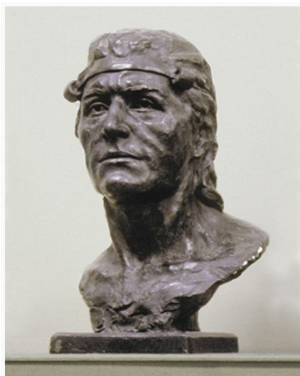
Голова мужчины (Пепкинский курган, Республика Марий Эл). Реконструкция Г. В. Лебединской. Лаборатория антропологической реконструкции Института этнологии и антропологии РАН.

Поселения с мощным культурным слоем, с остатками наземных жилищ, полуземлянок, реже землянок каркасно-столбовой конструкции, открытыми очагами, хозяйств. и жертвенными ямами внутри построек известны в Подонье и на Юж. Урале. В остальных районах изучены сезонные стоянки скотоводов с остатками каменных очагов.