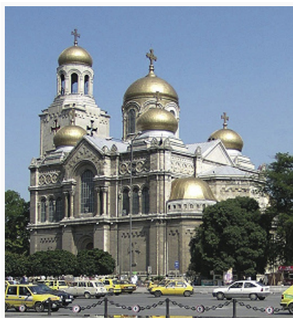
Варна. Успенский собор. 1883–86.

Драматич. театра им. С. Бочварова (1912–32, арх. Н. Лазаров).