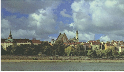
Вид Варшавы со стороны района Прага.