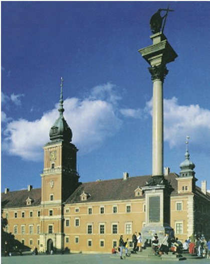
Варшава. Замковая площадь с Королевским замком (1599–1619, восстановлен в 1970-е гг.) и колонной Сигизмунда III (1643–44).