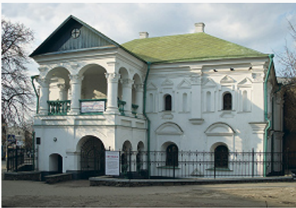
Дом Петра I. Нач. 18 в.