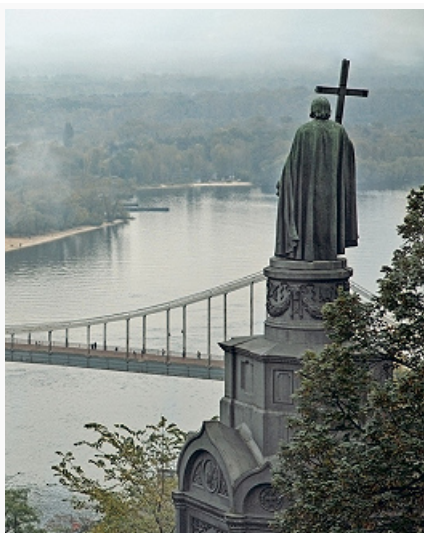
Памятник князю Владимиру Святославичу на берегу Днепра. 1853. Скульпторы В.И. Демут- Малиновский, П.К. Клодт. Архитектор К.А. Тон