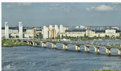
Вид на мост имени Е. Патона и новые жилые районы на

К. – крупный центр науки, образования и культуры Украины. В К. находятся Нац. АН Украины (1918), Академия аграрных наук (1990), Академия педагогич. наук (1992), Академия мед. наук (1993). Среди НИИ, не входящих в состав АН и отраслевых академий, – Ин-т автоматики (1957), Междунар. ин-т социологии (1990), Центр политич. исследований и конфликтологии (1993), Центр социально-экономич. исследований (1999), Ин-т эволюционной экономики. В К. функционируют св. 70 вузов, в т. ч. имеющие статус национальных: Ун-т «Киево-Могилянская академия», Киевский национальный университет им. Т. Г. Шевченко (1834), Нац.