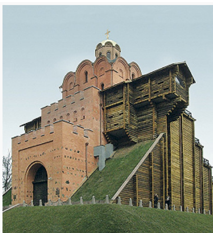
Золотые ворота. 1037 (реконструкция 1980-х гг.).

найденная постройка – 887), где жили ремесленники и купцы. Улицы и усадьбы 10 в. исследовались в 1972 на Красной пл. на глубине до 12 м (П. П. Толочко, К. Н. Гупало). На Старокиевской горе и вдоль Кирилловских высот обнаружены большие курганные могильники 10 в., насчитывавшие неск. тысяч насыпей. В них найдены богатые камерные захоронения с керамич. и металлич. посудой, украшениями, оружием, араб. и визант. монетами. В нескольких из 200 раскопанных погребений киевского некрополя найдены вещи скандинавского круга (серебряные фибулы, изделия из кости).