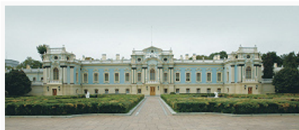
Фото А. И. Нагаева Мариинский дворец. 1745–52.

На живописных холмах в центре города сохранились постройки 10 – нач. 13 вв.: фундаменты великокняжеских дворцов 10 в. на Старокиевской горе, фундаменты Десятинной ц. (989–996), церкви Св. Георгия, церкви на Владимирской ул., церкви Дмитриевского мон. (все 11 в.), Софийский собор , фрагменты каменных Золотых ворот (1037, павильон-реконструкция, 1982), Михайловская ц. Выдубецкого мон. (1070–88, восстановлена в 1766–69, арх. М. И. Юрасов), Троицкая надвратная ц. (1106–1108) и фрагменты первого кирпичного Успенского собора Киево-Печерской лавры , фундаменты церкви Кловского мон. (построена к 1108), часть ц. Спаса Преображения на Берестове (1113–25, перестроена в 1640–43), руины церкви на Вознесенском спуске (кон. 12 в.), фундаменты Трёхсвятительской церкви (кон. 12 – нач. 13 вв.; разобрана в 1935), фундаменты и 4 ряда кладки ротонды близ Десятинной ц. (кон. 12 – нач. 13 вв.). В сев. части К. – Кирилловская церковь ; в юж. части, в р-не Хутор Вольный, – Гнилецкие пещеры (монастырь с 11–12 вв., пришёл в запустение к 16 в., в 1900–28 – мон. Рождества Богородицы; в 1999 возрождён как скит Рождества Богородицы Голосеевской пустыни на Церковщине) и фундаменты церкви кон. 12 в. Ансамбль Софийского собора и Киево-Печерской лавры с ц. Спаса Преображения на Берестове включены в список Всемирного наследия .