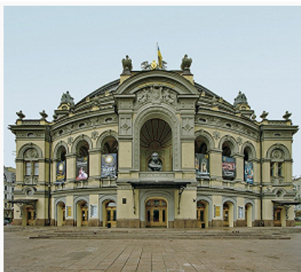
Киев. Украинский театр оперы и балета имени Т. Г. Шевченко.

Крупнейшие театры: Национальный академический театр оперы и балета Украины имени Тараса Шевченко, Национальный академический драматический театр имени Ивана Франко, Национальный академический театр русской драмы имени Леси Украинки. Среди др. театров: ТЮЗ на Липках (1924), кукол (1927), Киевский национальный академический театр оперетты (основан в 1934 как Театр муз. комедии, с 2009 совр. статус и название; в 2004 открыта камерная сцена – «Театр в фойе»), драмы и комедии «На левом берегу Днепра» (1978), «Золотые ворота» (1980), «Актёр» (1987), Театр марионеток (1989), Академический музыкально-драматический цыганский театр «Романс» (1993), Театр танца Светланы Шумковой (основан в 1996 как Ансамбль классич. танца, с 1999 совр.