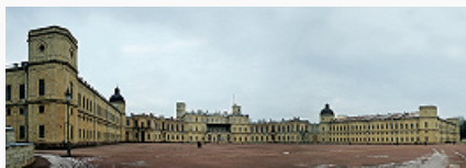
Гатчина. Дворец. 1766–90-е гг.