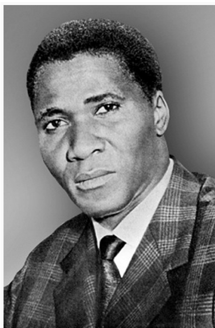
Ахмед Секу Туре. Фото. 1960.

В 1947 на базе гвинейской секции Африканского демократического объединения была создана Демократич. партия Г. (ДПГ), первая массовая политич. партия совр. типа, возглавившая нац.-освободит. движение. В сент. 1958 по призыву ДПГ на референдуме по проекту новой франц. конституции 95,4% избирателей высказались против вхождения Г. в состав Франц. сообщества. Г. стала единств. франц. колонией, население которой высказалось против конституции Ш. де Голля и поддержало идею полной независимости.