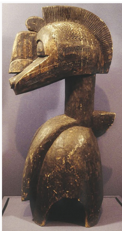
Деревянная фигурка народа бага. Музей народного искусства Цюрихского университета.

Осн. типы традиц. жилища – круглые в плане хижины с плетнёвыми, обмазанными глиной стенами и конусообразной соломенной кровлей. В городах с приходом европейцев появились прямоугольные в плане дома с террасами. После 2-й мировой войны строятся здания совр. типов, с применением новых конструкций и материалов; характерны жалюзи, сквозные решётки, покатые крыши. В сер. 20 в. в Г. работали франц. архитекторы (Г. Ланьо, А. Шомет и др.). В 1960–80-х гг. в столице Г. – Конакри при участии архитекторов из социалистич. стран сооружены обществ. и пром. здания (Политехнич. ин-т, стадион, радиоцентр, науч. центр – по проектам сов. архитекторов; типография – по проекту архитекторов ГДР). Характерные памятники иск-ва Г. – каменные статуэтки людей и животных, выполненные в обобщённой условной манере, украшенная резьбой старинная дерев. утварь, геометризованные человеческие фигурки с головами фантастич. существ, ритуальные маски из дерева и кости. Распространены плетение из соломы (сумки, веера, циновки с несложным орнаментом 2–3 цветов), набивка тканей тёмно-синим, оранжевым и красным геометрич. узором. С 1960-х гг. появились проф. художники (М. К. Фалло, М. Б. Косса, М. Конде, К. Нануман и др.). Худож. мастерская в Конакри изготавливает лубочные картинки (листы плотной чёрной бумаги с нанесёнными разноцветной гуашью схематичными экспрессивными изображениями нар. танцев и др. сюжетов).