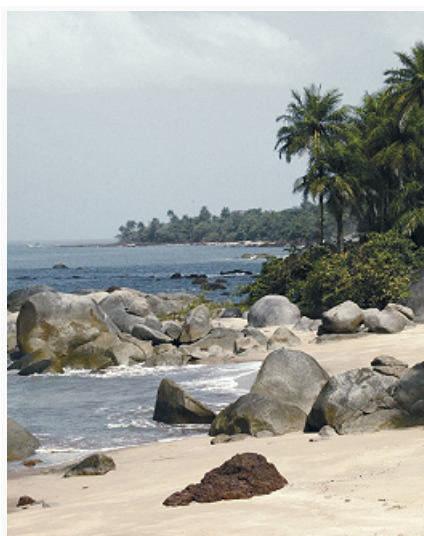
Фото Michel Hasson