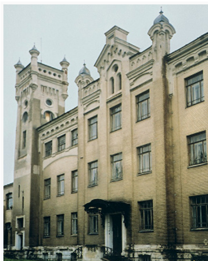
Учебно-административный корпус Егорьевского механико- электротехнического училища имени цесаревича Алексея. 1907– 09. Архитектор И. Т. Барютин.

90-е гг., строился под наблюдением архитекторов А. С. Каминского и И. Т. Барютина), церкви Св. Александра Невского (с 1880-х гг., арх. Н. Н. Вейс), Алексеевская (1900-е гг.), жилые дома кон. 19 – нач. 20 вв., в т. ч. дом Бардыгина (последняя четв. 19 в., с парадными апартаментами в духе эклектики и неоклассицизма), комплекс Механико-электротехнич. училища им. цесаревича Алексея в стиле модерн (1907–09, арх. Барютин; ныне Егорьевский технологический институт им. Н. М. Бардыгина), Дворец культуры текстильщиков (1929, арх. В. А. Щуко ).