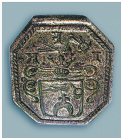
Минск. Печать, найденная во дворе монастыря василианок. Кон. 16 в. (по В. Е. Соболю).