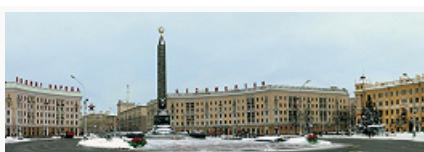
Минск. Площадь Победы. 1930 – 1950-е гг.

На левом берегу р. Свислочь – Троицкое предместье с застройкой 19 в. На юге Минска, при слиянии рек Свислочь и Лошица, – Лошицкий усадебно-парковый комплекс (18–19 вв.). В р-не Большая Слепянка – сельская усадьба Ваньковичей (1-я пол. 19 в.). На юго-зап. окраине Минска – усадьба Ададуриных «Белая дача» (кон. 19 в.).