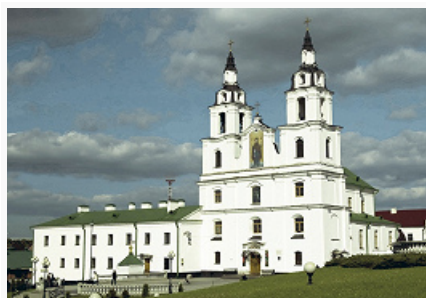
Минск. Кафедральный собор Сошествия Святого Духа. 1642–87. Реконструирован в 1741–65.

На правом берегу р. Свислочь сохранилась планировка и часть застройки Верхнего города: Ратуша (1582, снесена в 1857, восстановлена в 2002–03), барочные ансамбли быв. монастырей иезуитов (1654; костёл, ныне католический кафедральный собор Пресвятой Девы Марии, 1700–08, башни завершены в 1732, восстановлены к 2000), бернардинцев (1624, упразднён в 1864; костёл Св. Иосифа, 1644–52), бернардинок (1633, в 1870–1918 православный мон. Святого Духа; костёл, ныне православный кафедральный собор Сошествия Святого Духа, 1642–87, реконструирован в 1741–65), василианок (Святого Духа, 1641); гостиный двор (кон. 18 – 20 вв.), жилые дома 18 в. Также сохранились: руины 4-столпного храма на Замчище (строился, вероятно, в нач. 12 в. кн. Глебом Всеславичем), Петропавловская ц. (1612 – 1620-е гг., перестроена в 1870–75; в 1795–99 и 1844–1941 Свято-Екатерининский собор) быв. Свято-Петропавловского мон. (1613, упразднён в 1799).