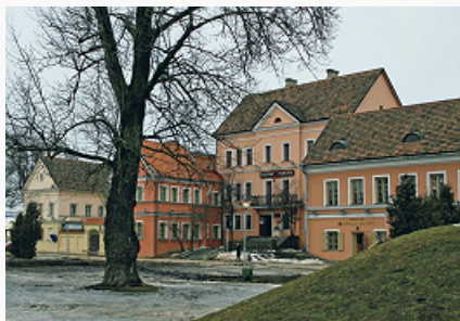
Минск. Застройка Троицкого предместья. 19–20 вв.