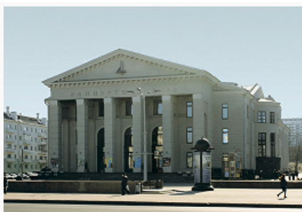
Минск. Белорусская государственная филармония.