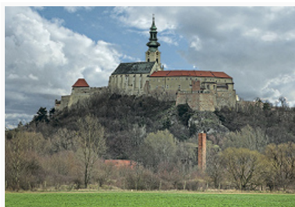
Нитра. Замок с кафедральным собором Святого Эммерама Регенсбургского. 9–18 вв.

эпиграветт). К неолиту относятся: один из крупнейших могильников линейно-ленточной керамики культуры ; поселение лужанской группы (протолендзель, см. Лендзель ) Млинаровце, где найден фрагмент медного шила (древнейшее металлич. изделие в Словакии), и др. Одна из групп памятников энеолита (фаза 3 культуры Лендзель) названа Бродзани – Нитра, др. группа, раннего бронзового века, – нитрянская культура. Эти и др. памятники неолита – бронзового века свидетельствуют об интенсивном заселении региона. Со среднего Латена регион Н. довольно плотно освоен кельтами (среди находок – уникальная для Центр. Европы рим. монета 235–220 до н. э. и др.). Кельто-дакийский горизонт 2-й пол. 1 в. до н. э. отражает экспансию даков (есть предположение о наличии в регионе Н. одного из их центров). Памятники 1-й пол. 1-го тыс. н. э. соотносятся с одной из групп квадов , испытывавших сильное влияние рим. культуры. Ок. 2-й – 3-й четв. 5 в. регион входил в зону вост.-герм. групп, подчинённых гуннам во время Великого переселения народов . Среди памятников пражской культуры на территории Н. есть относящиеся к первым волнам заселения Карпатской котловины славянами (2-я пол. или кон. 5 – 1-я пол. 6 вв.). К периоду Нитранского кн-ва на территории Н. относятся городища, селища, богатые могильники; изучался и ряд более поздних памятников.