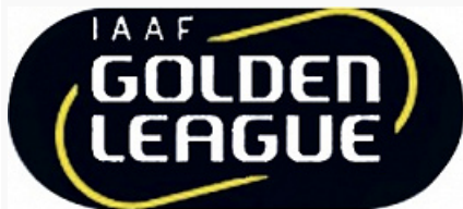
«Золотая лига». Эмблема соревнований.