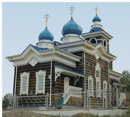
Благовещенская церковь в селе Нелькан. 1914–15.