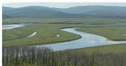
Долина реки Горин (Горюн), бассейн реки Амур.

Х. к. отличается хорошо развитой гидросетью, по водообеспеченности занимает одно из первых мест в РФ. Насчитывается 210 тыс. рек общей протяжённостью 584 тыс. км. Большинство рек принадлежит бассейну р. Амур (длина в пределах края 1540 км) – Буряя, Тунгуска, Горин (Горюн), Амгунь, Уссури, Анюй, Гур. Они имеют дождевое питание (70–80%), небольшие весенние паводки и высокие паводки во второй половине лета, нередко приводящие к катастрофич. наводнениям (последнее в 2013, уровень воды у г. Хабаровск достиг 808 см при ср. значениях 346 см, были затоплены части городов Хабаровск, Комсомольск-на-Амуре, Николаевск-