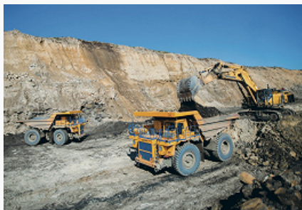
Добыча каменного угля. Разрез «Буреинский».