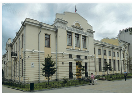
Здание Дальневосточной конторы Госбанка СССР в Хабаровске. 1927–28. Архитектор Б. Л. Боровик.

в Охотске (1891; все не сохр.), в Бикинской станице (1895; ныне г. Бикин), Рождества Христова в Хабаровске (1897–1900), Благовещенская в с. Нелькан (1914–1915). Сохранилась дерев. застройка нач. 20 в. в Николаевске-на-Амуре, пос. Охотск, с. Верхнетамбовское. Среди каменных укреплений: крепость в Николаевске-на-Амуре (разрушена в 1920), система укреплений близ пос. Чныррах (более 45 объектов; 1854, 1865–70, 1904–14), форты в заливах Де-Кастри и Императорской Гавани (ныне Советская Гавань; восстановлены в 1932); маяки (Николаевский, Кластер-Кампский на мысе Орлова, оба 1895–97). В Хабаровске с 1870–80-х гг. строились здания в духе эkleктизма (дом воен. собрания, 1884), в русско-византийском стиле возведён Успенский собор (1883–89, арх. С. О. Бер; взорван в 1930), в русском стиле – ц. Св. Иннокентия Иркутского (1896–98, инженеры В. Г. Мооро и Н. Г. Быков), в стиле модерн – гостиница «Эспланад» (1909–13), построен ж.-д. мост через Амур (1913–16, проект Л. Д. Проскурякова; фермы заменены в 1992–2008); в формах неоклассицизма работали архитекторы П. В. Бартошевич, Б. А. Малиновский и др. Продолжали использоваться традиц. зимние и летние жилища (чумы), святилища, хозяйств. постройки нанайцев, нивхов, удэгейцев, ульчей, эвенков и эвенов (этнографич. комплекс «Ульчская деревня» в с. Джари на берегу р. Амур).