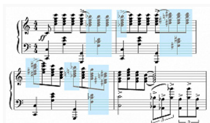
Рис. 2. "Рапсодия в блюзовых тонах" Дж. Гершвина. Клавир, такты 115–118. Лад целого – до-мажор. Систематическое использование композитором блюзовых нот (подсвечены голубым цветом) приводит...

С точки зрения теории музыки разные Б. н. получают разное функциональное толкование. VII низкая ступень придаёт мажорному ладу целого миксолидийский оттенок (см. Модализм ), III низкая придаёт ему же эффект «минорного» мерцания, превращая лад целого в мажоро-минор. V низкая (она же IV высокая) в мажоре и миноре выполняет орнаментальную функцию (см. Орнаментика ) и не меняет существо ладовой системы джаза. В отечественной науке для описания блюзовой разновидности тональности используется термин «блюзовый лад», в американской литературе в близком значении употребляется термин «blue tonality» (или «blues tonality»).