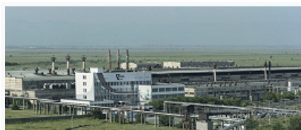
Саяногорский алюминиевый завод.

Осн. машиностроит. предприятия (в Абакане): «Абаканвагонмаш» (в составе компании «РМ Рейл», грузовой подвижной состав для железных дорог), опытно-механич. завод (спец. техника для лесопромышленного комплекса).