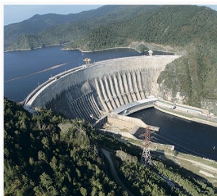
Саяно-Шушенская ГЭС. ПАО «РусГидро»

Добыча каменного угля (14,6 млн. т, 2014, в т. ч. ок. 40% – на экспорт) ведётся на месторождениях Минусинского каменноугольного бассейна группой компаний СУЭК (разрез «Черногорский», добыча 5,5 млн. т в год; шахта «Хакасская», 1,6 млн. т в год; «Восточно-Бейский разрез» – Бейское месторождение, 3,0 млн. т в год; «Разрез Изыхский» – Изыхское месторождение, 0,4 млн. т в год) и компанией «Русский Уголь» («Разрез Степной» – Черногорское месторождение, 4,0 млн. т в год). Обогабит. фабрика (с 2011; объём переработки угля 3,2 млн. т в год).