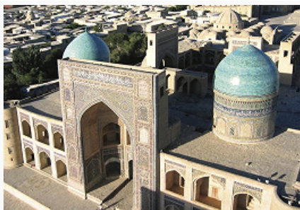
Бухара. Фрагмент ансамбля Poi-Калян.

Духовные круги Б. представляли собой сплочённую корпорацию, жившую по нормам шариата и следившую за строгим соблюдением этих норм в городе. Первым лицом в их среде являлся «кади-калон» (верховный судья Б. с офиц. титулом «убежище шариата»). С ними были вынуждены считаться даже светские государи Б. Так, эмир Абул-Ахад (1885–1910) из-за конфликта с духовными кругами Б. все годы правления провёл вне столицы своего государства. Верхушка бухарского «мусульманства» в своей политике умело использовала многотысячную корпорацию «мулло-бачей» – слушателей многочисл. медресе. С их участием неоднократно организовывались шумные публичные выступления против любых новаций. Мн. бухарские мечети, медресе и мазары до 1920 владели немалой «богоугодной» собственностью («вакфами»): земельными угодьями, караван-сараями, торговыми лавками и пр.