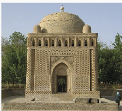
Бухара. Мавзолей Исмаила Самани. Кон. 9 – нач. 10 вв.