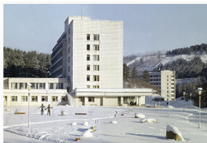
Курорт Белокуриха на Алтае.