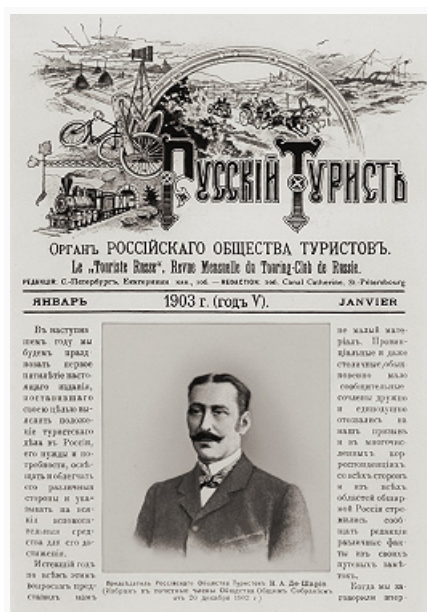
Титульный лист журнала «Русский турист» (1903).

отдыхающих в Баден-Бадене, Ницце, Биаррице и на др. европейских курортах. На них ориентировался местный туристский бизнес: открывались «русские пансионы»; издавалась периодическая печать на рус. языке. Регулярно проходили «русские сезоны».