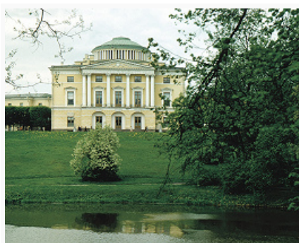
Павловск. Дворец (1782–86, архитектор Ч. Камерон).

Куршская Коса) и ностальгический туризм из Германии. В 2000 насчитывалось 37 гостиничных и 39 специализированных средств размещения общей вместимостью 7,9 тыс. мест (0,7% общей единовременной вместимости); 197 предприятий общественного питания на 11,5 тыс. посадочных мест. Работали 47 турфирм, по линии которых зарегистрировано 18,1 тыс. прибытий и 13,7 тыс. отбытий. Осн. въездные туристские потоки – из Москвы, С.-Петербурга, некоторых отдалённых регионов РФ, а также из Литвы (шоп-туризм) и Белоруссии. Активные контакты с Польшей и Германией.