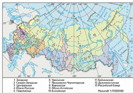
Туристские зоны федерального значения