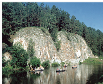
Сплав туристов по р. Белая (Урал).

горно-лыжный (в районе Жигулей) и приключенческий туризм, в т. ч. сплавы по рекам Сура, Хопёр, Дон и др. Популярны бальнеологические курорты Эльтон (Волгоградская обл.), Ундоры (Ульяновская обл.) и др. В 2000 насчитывалось 695 гостиничных и 1009 специализированных средств размещения общей вместимостью 172,2 тыс. мест (ок. 15% общей единовременной вместимости). Наряду со строительством пансионатов, загородных гостиничных комплексов (Самара, Тольятти) и небольших частных гостиниц имеются международные гостиничные цепи «Марриотт» и «Холидей Инн». Св. 6 тыс. предприятий общественного питания на 385 тыс. посадочных мест. Работали 253 турфирмы; зарегистрировано 80,6 тыс. прибытий (8,4% общего числа по линии турфирм) и 135,9 тыс. отбытий (11,2%). Во въездном туризме доминируют внутризональные потоки и из соседних регионов. Растущий поток бизнес-туристов – иногородних и иностранных специалистов – придаёт новый импульс развитию делового туризма.