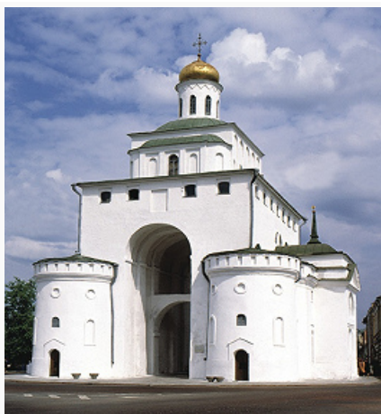
Владимир. Золотые ворота (1158–64; перестроены в 17–18 вв.).

рубежа – из Эстонии, Латвии, Литвы, Финляндии, Швеции, США, Германии, Франции.