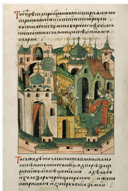
Лазарь Сербин устанавливает часы в Кремле. Миниатюра Лицевого летописного свода. 2-я пол. 16 в.

Редактор-составитель Никоновской летописи (кон. 1520-х гг.) последовательно проводил идеи защиты имущественных интересов церкви, союза светской и духовной власти, полной поддержки политики вел. кн. московского Василия III Ивановича, разрабатывал вопросы церковного права. С привлечением широкого круга летописных источников и документов великокняжеского архива в 1542–44 составлена Воскресенская летопись, анонимный составитель которой был сторонником рода князей Шуйских в политической борьбе 1530–1540-х гг.