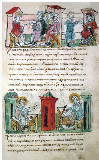
Писцы. Миниатюра Радзивилловской летописи. Кон. 15 в. Библиотека Академии наук (С.-Петербург).

известным с сер. 11 в.), жития рус. святых, церковные и светские повести, а также официальные документы (напр., договоры Руси с Византийской империей нач. 10 в.) и нар. сказания. Зачастую летописи толковали факты в интересах того правителя или центра, при котором они велись, являясь отражением политической борьбы на Руси.