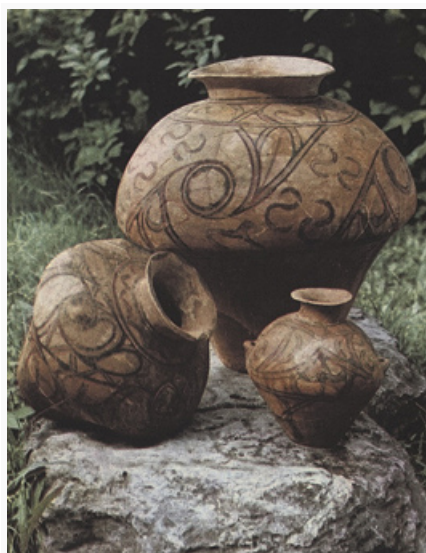
Керамика трипольской культуры. 4-

На западе в результате развития и расширения Балкано-Карпатской области раннеземледельческих культур в зону её влияния попадают территории Северо-Западного Причерноморья, Поднестровья и Побужья, где распространяются т.н. гумельницкая и трипольская (иначе культура Кукутени-Триполье) археологические культуры. Основу хозяйства этих культур составляли зерновое земледелие и придомное животно-водство (мелкий и крупный рогатый скот). На ранних стадиях земледелие было, скорее всего, мотыжным, для поздних предполагается знакомство с примитивными пахотными орудиями. Долговременные поселения с одно- и двухэтажными глинобитными домами имели круговую планировку (их площадь достигала до 400 га) и включали до 1000 жилищ. По мере истощения почв посёлки забрасывались, и население уходило на новые земли, постепенно расселившись вплоть до среднего течения Днепра.