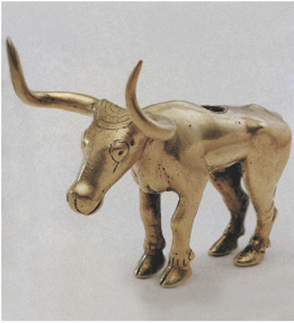
Фигурка быка из Майкопского кургана (Майкоп). Золото. 1-я пол. 3-го тыс. до н. э. Исторический музей (Москва).

На Кавказе на смену энеолитической земледельческой культуре приходит куро-араксская культура, сочетающая земледелие и придомное животноводство с отгонным скотоводством, базирующимся на освоении горных пастбищ. Лишь в Средней Азии продолжается последовательное развитие земледельческих культур (Намазга III–IV), приведшее в среднем бронзовом веке к появлению здесь сходных с ближневосточными памятниками протогородских центров со специализированными кварталами ремесленников, храмовым комплексом, хранилищами (Намазга V).