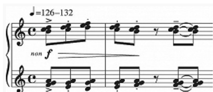
1. Р. К. Щедрин. Соната для фортепиано. I часть.