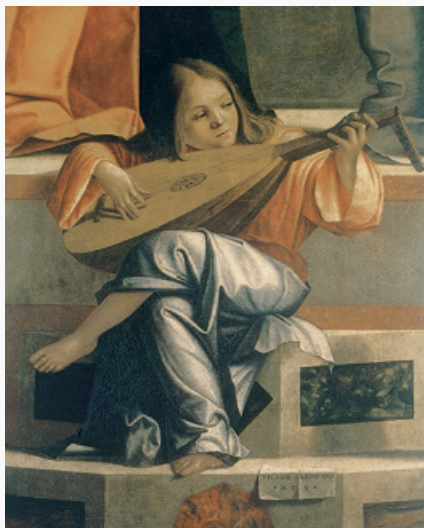
В. Карпаччо. «Сретение». Фрагмент. 1510. Галерея Академии (Венеция).

ЛЮТНЯ (польск. lutnia , от итал. liuto , от араб. аль'уд, букв. – дерево), струнный щипковый инструмент ( хордофон ), распространённый в Европе в 15–17 вв.