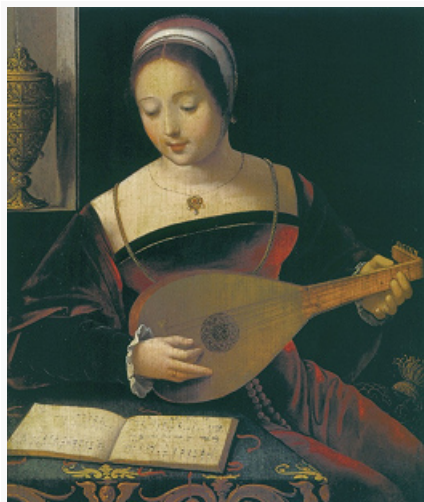
«Мадлен, играющая на лютне». Картина работы неизвестного фламандского мастера 16 в. Кунстхалле (Гамбург).