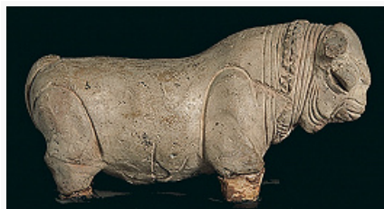
Хараппская цивилизация периода расцвета, Мохенджо-Даро. Терракотовая статуэтка быка. Национальный музей (Нью-Дели).