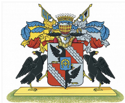
Герб графов Чернышёвых.