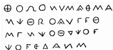
Карийская надпись из Карики.

На основании лингвистического анализа этих материалов определена генетическая принадлежность К. я. к лувической группе хетто-лувийских языков . В его дешифровке остаётся много неясностей ввиду фрагментарности текстов.