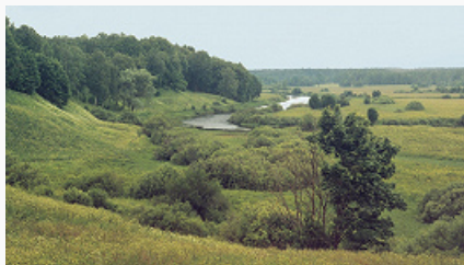
Восточно-Европейская равнина. Смешанные леса.

В.-Е. р. – классический образец территории с чётко выраженной широтной и субширотной зональностью природных ландшафтов. Почти вся равнина находится в умеренном географическом поясе и только северная часть – в субарктическом. На севере, где распространена многолетняя мерзлота, небольшие площади с расширением на восток занимает зона тундры: типичные мохово-лишайниковые, травяно-мохово-кустарничковые (брусника, голубика, вороника и др.) и южные кустарниковые (карликовая берёза, ива) на тундрово-глеевых и на болотных почвах, а также на карликовых иллювиально-гумусовых подзолах (на песках). Это дискомфортные для проживания ландшафты с низкой способностью к восстановлению. К югу узкой полосой протягивается зона лесотундры с низкорослым берёзовым и еловым редколесьем, на востоке – с лиственницей. Это пастбищная зона с техногенными и полевыми ландшафтами вокруг редких городов. Около 50% территории равнины занимают леса. Зона темнохвойной (главным образом, еловой, а на востоке – с участием пихты и лиственницы) европейской тайги, местами заболоченной (от 6% в южной до 9,5% в северной тайге), на глееподзолистых (в северной тайге), подзолистых почвах и подзолах расширяется к востоку. Южнее находится подзона смешанных хвойно-широколиственных (дуб, ель, сосна) лесов