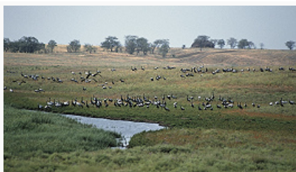
Восточно-Европейская равнина. Степь.