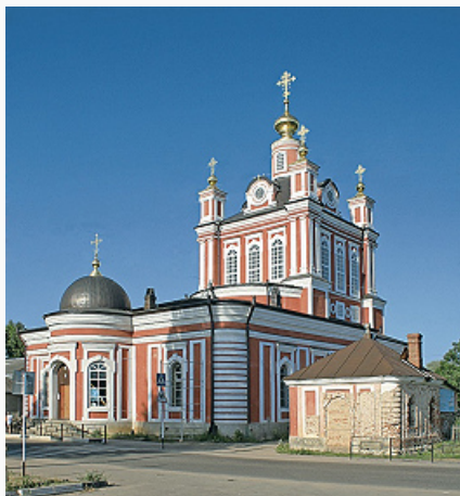
Торопец. Собор Корсунской иконы

На берегу оз. Соломенное сохранились остатки старой застройки. Б. ч. города с 1780-х гг. получила новую регулярную планировку (генплан 1778). В пределах сохранившихся валов городища Красный вал – т. н. дом воеводы (18 в.), ц. Живоначальной Троицы (1755, перестроена в сер. 20 в.), ц. Богоявления в духе т. н. торопецкого барокко (1762–66), собор Корсунской иконы Божией Матери (1795–1804, арх. О. Спиркин). Торопецкий посад занимал в окружности ок. 3 км и состоял из Старого острога, Посадской, Стрелецкой и Пушкарской слобод. Здесь сохранились церкви: Казанской иконы Божией Матери (ок. 1697, ремонт 1757–65), Рождества Иоанна Предтечи (1703–04), Спаса Преображения (1706), Рождества Пресвятой Богородицы (1757; по др. данным – 1752 или 1762), Успения Пресвятой Богородицы (1758–68); застройка Базарной пл. с торговыми рядами (кон. 18 в.) и т. н. домом с портиком (1-я пол. 19 в.), каменные купеч. дома сер. 18 – 19 вв. На берегу Торопы – быв. Небин Троицкий мужской мон. (1592, закрыт в 1920-е гг.) с Троицким собором (освящён в 1718). В 2005 учреждён Свято-Тихоновский женский мон. (на месте Николаевского особного мужского мон., упоминается с 16 в., упразднён в 1764) с ц. Св. Николая Чудотворца типа «восьмерик на четверике» (1666–97) и барочной ц. Покрова Пресвятой Богородицы (1766–74). Сохранились также ц. Вознесения Господня (1780-е гг.), ц. Всех Святых (1794). В юж. части города – кладбищенская ц. Святых жён-