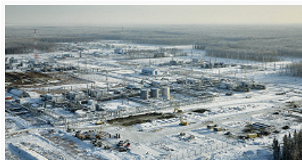
Добыча природного газа.