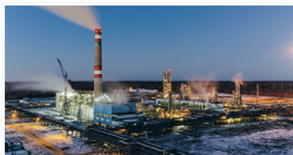
ПАО «СИБУР Холдинг»

переменного тока, ок. 10% силовых гибких кабелей, ок. 10% подшипников качения. Развиваются высокотехнологичные произ-ва (б. ч. предприятий – резиденты особой экономич. зоны технико-внедренч. типа «Томск»).