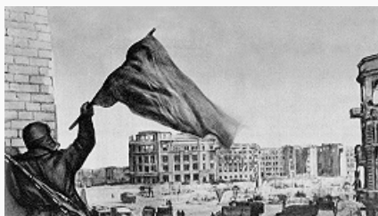
Красное знамя над освобождённым Сталинградом. Февраль 1943.

С. б. – одна из крупнейших во 2-й мировой войне. Она положила начало коренному перелому не только в ходе Вел. Отеч. войны, но и во всей 2-й мировой войне в целом. В ходе её противник потерял четвертую часть сил, действовавших на сов.-герм. фронте. Общие потери врага убитыми, ранеными, пленными и пропавшими без вести составили ок. 1,5 млн. чел., в связи с чем в Германии впервые за годы войны был объявлен нац. траур. Потери Красной Армии составили ок. 1 млн. 130 тыс. чел. (из них ок. 480 тыс. безвозвратные). Стратегич. инициатива прочно и окончательно перешла в руки сов. Верховного Главнокомандования, были