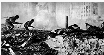
Бой на улице Сталинграда. Фото 1942.

(ок. 270 тыс. чел., 3 тыс. орудий и миномётов, ок. 500 танков; команд. — ген.-полк., с 31.1.1943 ген.-фельдм. Ф. Паулюс ), которую поддерживала авиация 4-го возд. флота (до 1,2 тыс. боевых самолётов). 31 июля сюда была переброшена с сев.-кавк. направления 4-я танковая армия.