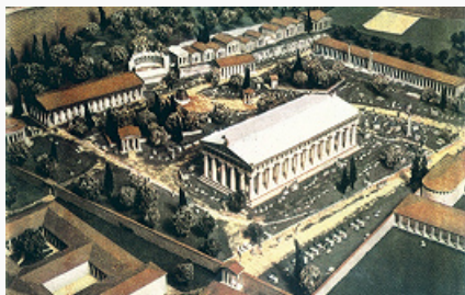
Макет Храма в Олимпии.

развиваться боевые искусства для самообороны и физич. совершенствования. В монастырях и храмах создавались разл. школы борьбы, которые вскоре завоевали популярность среди населения. В 1618 англ. король Яков I издал документ под назв. «Книга спортивных игр», в котором разрешалось в праздники и по воскресеньям играть в крикет, гольф, бильярд, теннис или заниматься греблей, охотой, стрельбой по мишеням.