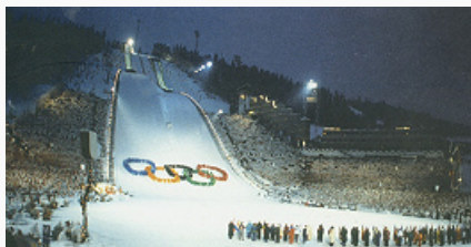
Церемония открытия Олимпийских зимних игр в Сараево (1984).

ОЛИМПЬЙСКИЕ ЗИМНИЕ ИГРЫ, комплексные соревнования по зимним видам спорта, проводимые МОК 1 раз в 4 года. Решение о регулярном проведении самостоятельных Олимпийских зимних игр принято в 1925 на Сессии МОК в Праге. Этому способствовал успех всемирных соревнований по зимним видам спорта – Международной спортивной недели по случаю VIII Олимпиады (1924, Шамони, Франция), которой МОК присвоил наименование «I Олимпийские зимние игры»; термин «Олимпиада» в связи с Олимпийскими зимними играми не принят, но в