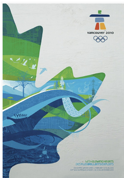
Плакат Олимпийских зимних игр в Ванкувере (2010).

(генерал-губернатор Канады); Сочи, 2014 – Владимир Владимирович Путин (президент России). За всю историю Белых олимпиад только дважды их открывали женщины (Осло, 1952; Калгари, 1988).