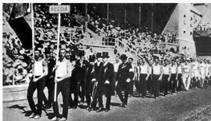
Делегация России на церемонии открытия Олимпийских игр в Стокгольме (1912).

ОЛИМПЬЙСКИЕ ИГРЫ (летние Олимпийские игры, Олимпиада), крупнейшие международные комплексные спортивные соревнования современности. Принципы, правила и положения Олимпийских игр определены Олимпийской хартией . По предложению П. де Кубертена решение об организации Олимпийских игр по образу античных и о создании Международного олимпийского комитета (МОК) было принято Международным спортивным конгрессом в Париже в 1894. Олимпийские игры проводятся в первый год олимпиады . Счёт олимпиадам ведётся с 1896, когда состоялись первые Олимпийские игры. Олимпиада получает свой номер и в тех случаях, когда игры не