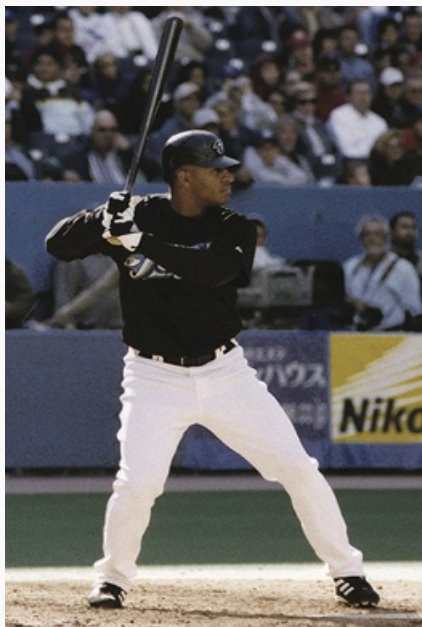
Бейсбол: эпизод игры.

БЕЙСБОЛ (англ. baseball; от base – база, основание и ball – мяч), спортивная командная игра (по 9 полевых игроков в каждой команде, замены не ограничены) с битой (деревянная, конусообразной формы; длина 1,07 м, диаметр бьющей части 7 см) и мячом (окружность 23 см, масса до 150 г) на травяном или с искусственным покрытием поле (98,5×98,5 м, в которое «вписан» квадрат со стороной 27,45 м, с т. н. базами по его углам). Игра состоит из 9 иннингов (периодов), каждый из которых делится на две части; соперники по одному разу играют в защите и нападении. Защищающаяся команда подаёт мяч и пытается помешать соперникам отбить его и сделать результативную перебежку – пробег игрока нападающей команды через три «базы» в «дом» («исходную базу»).