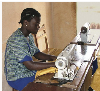
Швейная мастерская в Котону.

Б. – аграрная страна, одна из наименее развитых в мире. Объём ВВП (по паритету покупательной способности, 2015) 22,95 млрд. долл.; в расчёте на душу населения около 2,1 тыс. долл. Индекс человеческого развития 0,480 (2015; 166-е место среди 188 стран мира).