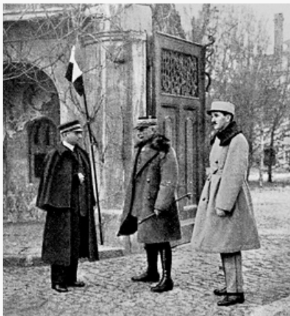
Командующий союзными войсками

15 марта руководители Франции, Великобритании и Италии признали необходимость воен. интервенции в России. В Сибири эту задачу предлагалось возложить на Японию, но при условии активной её поддержки со стороны США. 5 апр. во Владивостоке был высажен десант с япон. эскадры, а затем по просьбе брит. консула в город прибыло подразделение брит. мор. пехоты. На Северо-Западе фин. войска вторглись в Карелию. В конце апреля – начале мая воен. миссии держав Антанты в России разработали «План объединённой интервенции на Севере и в Сибири», утверждённый в июне – июле Высшим воен. советом Антанты. В конце мая началось Чехословацкого корпуса выступление 1918 , вскоре охватившее всю Транссибирскую магистраль . В начале июня на совещании воен. представителей Антанты в Париже было решено занять Мурманск и Архангельск силами союзных войск. На Севере началось формирование Славяно-брит. легиона (ком. – полк. К. Гендерсон). 2 июля Верховный совет Антанты решил расширить действия союзников на Севере. США 6 июля приняли решение, при условии согласия Японии, сосредоточить во Владивостоке до 7 тыс. амер. и 7 тыс. япон. военнослужащих для охраны коммуникаций Отд. Чехосл. корпуса и совместных, в случае необходимости, с ним действий.