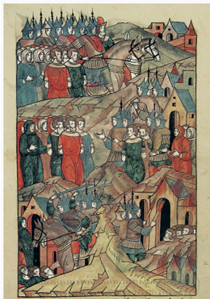
«Ордынский набег на Рязанскую землю в 1380». Миниатюра из Лицевого летописного свода. 2-я пол. 16 в. Российская национальная библиотека (С.-Петербург).

Ханы З. О. проводили активную внешнюю политику. С целью распространения своего влияния на соседние страны они совершали походы на Вел. кн-во Литовское (1275, 1277 и др.), Польшу (кон. 1287), страны Балканского п-ова (1271, 1277 и др.), Византию (1265, 1270) и др. Глав. противником З. О. во 2-й пол. 13 – 1-й пол. 14 вв. стало гос-во Хулагуидов, которое оспаривало у неё Закавказье. Между двумя государствами неоднократно велись тяжёлые войны. В борьбе против Хулагуидов ханы З. О. заручились поддержкой султанов Египта.