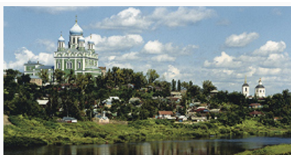
Елец. Вид города.

ЕЛЕ́Ц, город в России, в зап. части Липецкой обл., центр Елецкого р-на, образует гор. округ. Нас. 105,0 тыс. чел. (2017). Расположен на р. Сосна. Крупный узел железных дорог и магистральных газопроводов: «Прогресс» (Ямбург – граница с Украиной – страны Центр. и Зап. Европы), «Уренгой – Ужгород» и др.; близ города проходит магистральный нефтепровод «Дружба». Через Е. проходит федеральная автотрасса «Дон» (Москва – Воронеж – Ростов-на-Дону).