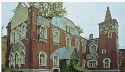
Елец. Бывший Дом призрения.