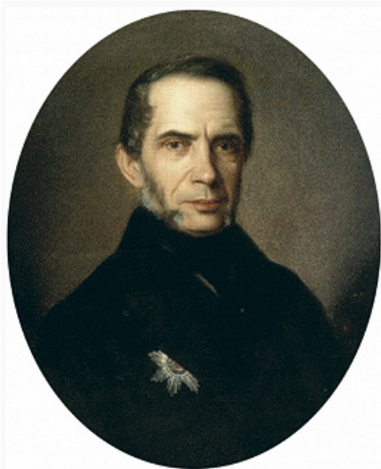
Д. И. Долгоруков. Портрет работы К. И. Лаша. 1855. Архангельский областной музей изобразительных искусств.