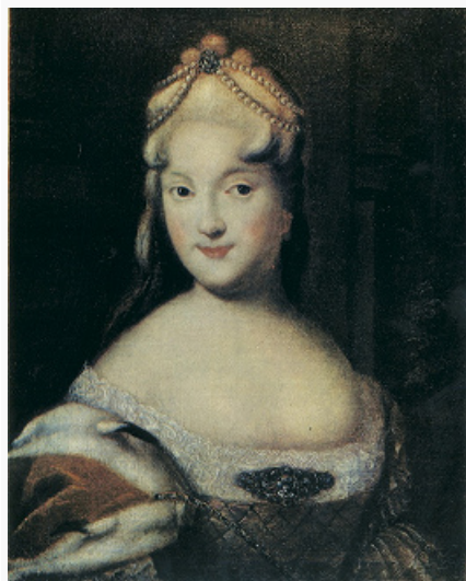
Е. А. Долгорукова. Портрет работы неизвестного художника. 1729. Псковский государственный объединённый историко-архитектурный и художественный музей-заповедник.

ДОЛГОРУКОВЫ (Долгорукие), рус. княжеский род, Рюриковичи , отрасль князей Оболенских. Родоначальник Д. — старший сын кн. А. К.