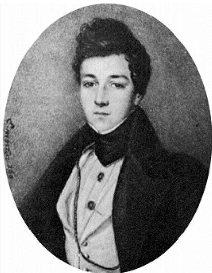
А. С. Долгоруков. Гравюра с портрета работы неизвестного художника. 2-я пол. 19 в.