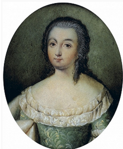
Н. Б. Долгорукова (урождённая графиня Шереметева). Портрет работы неизвестного художника с гравированного портрета 18 в. Сер. 19 в. Третьяковская галерея (Москва).

ссылке, в 1738 назначен послом в Великобританию, но, не успев выехать, вновь арестован по делу о подложном завещании и казнён в Новгороде; Иван Григорьевич [1680–8(19).11.1739], тайн. сов. (1729), сенатор (с 1728), казнён вместе с братом.