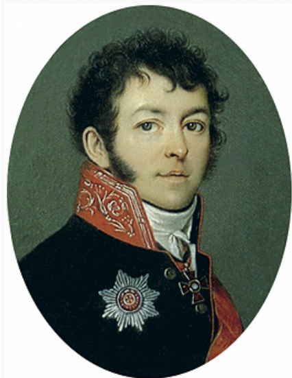
В. В. Долгоруков. Портрет работы неизвестного художника. Нач. 1820-х гг. Эрмитаж (С.-Петербург).