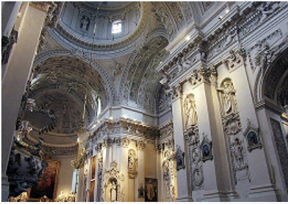
Вильнюс. Костёл Святых Петра и Павла. Интерьер. 1677–1704.

Нижнего [сохранились: Старый арсенал, 15 в.; Новый арсенал, 15 – сер. 16 вв., ныне здание Нац. музея Литвы; кафедральный собор на центральной пл. Гедиминаса (Гедимино), основан в 1387, перестроен в 1783–1801, архитекторы Л. Стуока-Гуцявичюс, М. Шульц] и Кривого (сожжён крестоносцами в 1390; ныне территория Нагорного парка). Архит. ансамбли: сформированный костёлами Св. Анны (Онос, 15–18 вв.; фасад в стиле кирпичной готики , 16 в.), Св. Михаила (1594–1625; сочетание черт готики и ренессанса) и монастырём бернардинцев (готич. костёл; фронтон – кон. 17 в.); комплекс зданий и закрытых двориц Вильнюсского ун-та (2-я пол. 16 – нач. 19 вв.). Среди др. архит. памятников: готич. костёл Св. Николая (14 в.), ворота Аушрос (1503–22; в 1715 устроена надвратная часовня с иконой Милосердной Богоматери, 16 в.), ренессансный дворец Алумната (1582–1622, 18 в.), барочные костёлы Св. Казимира (1604–18, архитекторы Й. Праховичюс и П. Бокша), Св. Духа (1610–33), Св. Терезы (1633–50, арх. Ульрик), Святых Петра и Павла (1668–86, арх. Й. Заор; барочный декор интерьера, 1677–1704), дворцы Слушек (1690–1700) и Сапег (1691–1769). В стиле классицизма построены: Ратуша (1781–99, арх. Л. Стуока-Гуцявичюс; ныне Литов.