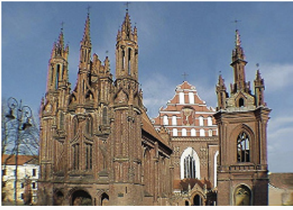
Вильнюс. Костёл Святой Анны (Онос) (15–18 вв.) и монастырь бернардинцев.