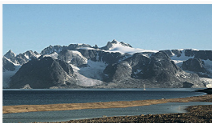
Побережье острова Шпицберген.