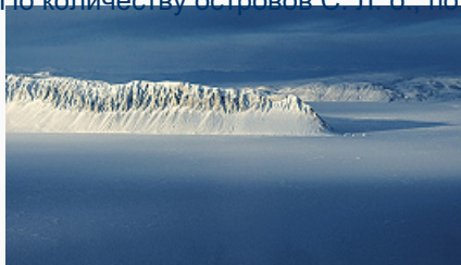
Остров Элсмир (Канада).

По количеству островов С. Л. о. по некоторым оценкам, занимает 2-е место после Тихого ок. Общая площадь