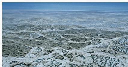
Ледниковый покров на Карском море.

Осн. особенности циркуляции вод, льдов и гидрологич. режима С. Л. о. определяют: рельеф дна и конфигурация берегов, распределение островов и гл. архипелагов, высокая степень изолированности С. Л. о. от др. районов Мирового ок., водообмен с Тихим и Атлантическим океанами, изменения в структуре атмосферной циркуляции, материковый сток.