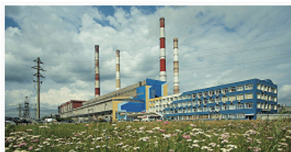
Рефтинская ГРЭС. ОАО «Энел Россия»

Объём пром. продукции 1478,2 млрд. руб. (2013); из них 85,1% приходится на обрабатывающие произ-ва, 11,2% – на произ-во и распределение электроэнергии, газа и воды, 3,7% – добычу полезных ископаемых. Отраслевая структура обрабатывающих произ-в (%): металлургия 54,3, машиностроение 17,9, пищевкусовая пром-сть 5,8, химич. пром-сть 5,0, произ-во стройматериалов 4,8, деревообработка и целлюлозно-бумажная пром-сть, полиграфич. произ-во 1,5, др. отрасли 10,7.