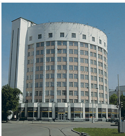
Общежитие в «Городке чекистов» в Екатеринбурге (ныне гостиница «Исеть»). 1933.

С сер. 19 в. активно возводятся монастыри: женские Свято-Покровский в с. Колчедан (община с 1850, с 1901 монастырь, закрыт в 1924), Преображенский в Каменск-Уральском (община с 1860, с 1892 монастырь, закрыт в 1920, возобновлён как мужской в 1998; Спасо-Преображенская ц., 1872–78), Красносельский Введенский (ныне пос. Рассвет; община с 1875, с 1899 монастырь, закрыт в 1924), Скорбященский в Нижнем Тагиле (в честь иконы Божией Матери «Всех скорбящих Радость»; богадельня с 1884, с 1904 монастырь, закрыт в 1919, возрождён в 1998; Вознесенский собор, 1905–13), Елизавето-Мариинский близ пос. Шамары (1916, закрыт в 1920), мужской Кыртомский Крестовоздвиженский (ок. 1872, закрыт в 1920-е гг.). В русско-византийском стиле построены 5-главая ц. Св. Максима Исповедника в Краснотурьинске (1844–51), храм-колокольня Большой Златоуст в Екатеринбурге (1847–76, арх. В. Е. Морган; выс. 77 м; разрушен в 1930, воссоздан в 2006–09), 5-шатровые ц. Св. Александра Невского в Нижнем Тагиле (1862–77, предположительно арх. Т. Ф. Гирст), Спасская ц. в Екатеринбурге (1872–76; с 2007 подворье Ново-Тихвинского мон.), Сретенская ц. в пос. Старопышминск (1882–87), ц. Св. Марии Магдалины в с. Лая (1900–03) и ц. Рождества Христова в с. Сосновское (ок. 1915) и др.; с элементами мавританского стиля – часовня Св. Александра Невского в Краснотурьинске (1870-е гг.).