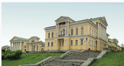
Главный дом усадьбы Л. И. Расторгуева в Екатеринбурге. 1794–1808.

Предтечи в пос. Верхняя Баранча (1844–52).