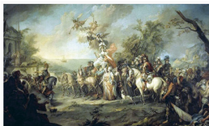
«Аллегория на победу Екатерины II над турками и татарами». Художник С. Торелли. 1772. Третьяковская галерея (Москва).