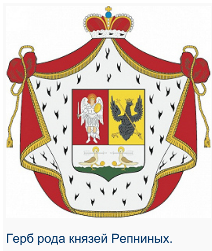
Герб рода князей Репниных.

РЕПНИНЫ́, рус. княжеский род, Рюриковичи , отрасль князей Оболенских .