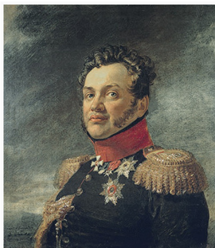
Н. Г. Репнин (до 1801 Волконский). Портрет работы мастерской Дж. Доу. 1822–26. Эрмитаж (Военная галерея Зимнего дворца, С.-Петербург).

(1572). Наместник в Путивле (1572–73). Его сын – Александр Андреевич [17.3 (г. рождения неизв.) – 3(13).1.1612], дворянин московский (не позднее 1598/99). Стольник (не позднее 1577). 1-й воевода в Переяславле-Рязанском (1593, 1595–97). После воцарения Бориса Фёдоровича Годунова попал в опалу, направлен воеводой в Яранск (1600/01), затем обвинён в хищениях и сослан с семьёй в Уфу. 1-й воевода в Нижнем Новгороде (1608–1611), остался верен царю Василию Ивановичу Шуйскому. Участвовал в походе на Москву Первого ополчения 1611 . Известны его сыновья: Пётр Александрович [? – 27.1(6.2).1643], боярин (1633). Стольник (с 1611), дворянин московский (с 1627). Участник моск. осадного сидения 1618. 1-й воевода в Переяславле-Рязанском (1625, 1639), в Великих Луках (1632–33), Новгороде (1635–37). 1-й судья приказов: Сысного и Сбора ратных людей (оба – 1638–39), Устюжской чети (1639); Б. А. Репнин . Старший сын Б. А. Репнина – И. Б. Репнин . Из сыновей последнего наиболее известен А. И. Репнин . Из сыновей А. И. Репнина наиболее известны: Василий Аникитич (1696–10.8.1748), ген.-