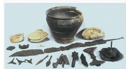
Пшеворская культура. Инвентарь погребения воина-всадника