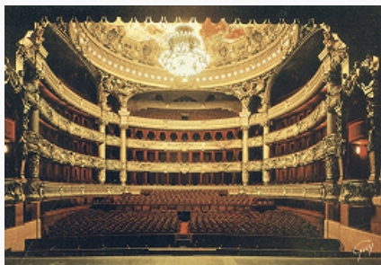
«Опера-Гарнье». Зрительный зал.