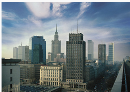
Варшава. Панорама современной части центра города.

Футбольные клубы: «Legia» (1916; 11-кратный чемпион Польши; выступает на стадионе «Войска Польского» (имени маршала Ю. Пилсудского); 1930, реконструкция 2008–11; 31,1 тыс. мест), «Polonia» (1911; принимает соперников на стадионе имени ген. К. Соснковского, 1928; 7,2 тыс. мест) и «Gwardia» (1948; победитель Кубка Польши 1954); баскетбольные клубы: «Legia» (выступает на многофункциональной арене «Коло»), «Polonia Warszawa» и «Politechnika» (1916; оба выступают на крытой арене «Torwarl»; 1953; 4,8 тыс. мест; в 2001 на ней прошёл финал Кубка Сопорты), волейбольный клуб «Politechnika». Национальный стадион (2011; 58,1 тыс. мест); ипподром (1939), открытый конькобежный трек «Stegny» (1979), водный парк «Варшавянка» с олимпийским бассейном (1999) и др. В В. ежегодно проходят традиционные легкоатлетические международный мемориалы Я. Кусочиньского (с 1954), марафон (с 1979) и полумарафон (с 2006); в 1995–2010 проходили теннисные турниры «Warsaw Open». Также проводились чемпионаты мира: по тяжёлой атлетике (2002), по волейболу (2014), по современному пятиборью (2014), по сумо (2010), по конькобежному спорту среди юниоров (2015) и др.; чемпионаты Европы: по фигурному катанию (2007), командный по бадминтону (2010), по футболу (2012), по шахматам – личный (2005) и командный (2013), по сумо (2014), по карате среди взрослых и детей (2015); кубок Европы по дзюдо (2015) и др. соревнования. В. избрана Европейской столицей спорта 2008.