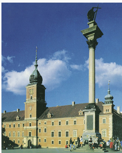
Варшава. Замковая площадь с Королевским замком (1599–1619, восстановлен в 1970-е гг.) и колонной Сигизмунда III (1643–44).