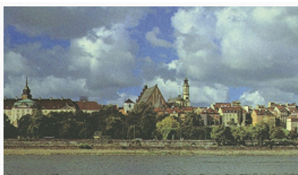
Вид Варшавы со стороны района Прага.