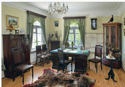
Пржевальское. Кабинет в доме Н. М. Пржевальского. Фото 2012. Фото И. К. Чернова, В. А. Цурганова

оставленным на ней в день отъезда в последнее путешествие автографом («5 августа 1888 года. До свиданья, Слобода!»); подлинные документы Пржевальского, ордена, личные альбомы с фотографиями близких родственников, друзей и спутников по экспедициям, рукопись лекций, прочитанных исследователем в Варшавском юнкерском уч-ще в 1866–67, ружья, подлинные карты и отчёты о 5 экспедициях путешественника, подлинные вост. предметы, чучела птиц и животных, гербарные листы, привезённые им из Монголии, Тибета, Китая, предметы личного снаряжения (в т. ч. походный самовар-чайник, экспедиц. ящики, нивелир). В экспозиции также представлены рисунки помощника