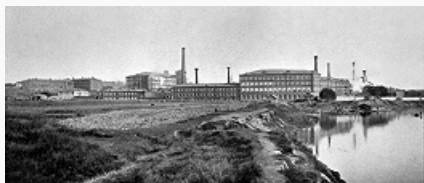
Фабрика Товарищества Прохоровской Трёхгорной мануфактуры. Фото нач. 20 в.