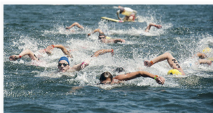
Плавание на открытой воде. Олимпийские игры в Лондоне (2012).

Наибольшее количество рекордов мира установила дат. спортсменка Р. Вегер (1920–2011); в её активе 44 рекорда мира (1936–43) на разл. дистанциях и в разл. дисциплинах. Среди мужчин наибольшее число рекордов у амер. пловца М. Спица, установившего 33 рекорда мира (1967–72).