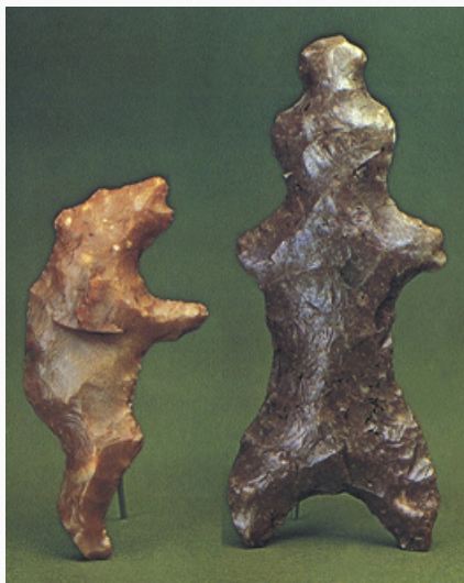
Кремнёвые фигурки медведей со стоянок лесной зоны Европейской части России. Неолит. Сер. 3-го тыс. до н.э. Исторический музей (Москва).

Одомашнены свиньи, мелкий и крупный рогатый скот. Появились укрепленные поселения. Если ранее известны только отдельные случаи обмена, как правило, редкими материалами (раковины, горный хрусталь, янтарь), то в неолите наблюдается развитый обмен, в осн. каменным сырьём, между разными областями. Появились кремнедобывающие шахты. Известны многочисленные районы с наскальными изображениями – петроглифами: районы Белого м., берегов Онежского оз., Каменная Могила в Приазовье, Беюк-Даш в Прикаспии, писаницы верхнего течения Енисея, Алтая, р. Амур и др. Широко представлены мелкая пластика, украшения; новым видом искусства можно считать орнамент, нанесённый на керамику, имеющий культуроразличающее значение. Погребальные памятники многочисленны – это и могильники, и одиночные погребения на стоянках. Погребальный обряд стандартен в пределах каждой археологической культуры, иногда характеризуется сложными сооружениями (курганые и бескурганые могильники, каменные ящики, грунтовые ямы и пр.), вариациями в позах погребённых (вытянутые, скорченные, с разной позицией рук, сидячие, известно одно