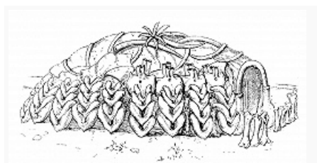
Палеолитическое жилище. Стоянка Межиричи (Ровненская обл., Украина).

Кроме того, существовали и другие технологические направления типа тейяк и клектон, имевшие заготовками отщепы неправильной формы, где окончательная форма изделий достигалась при помощи вторичной обработки. Осн. группы изделий эпохи мустье: скрёбла, остроконечники, скребки, ножи, проколки, свёрла, рубильца, костяные острия, ретушеры и др. Создание жилищ и использование естественных убежищ были обусловлены сильным похолоданием во 2-й половине периода мустье (валдайское оледенение). Наиболее характерны наземные жилища круглой или овальной формы с внутренними очагами; строительным материалом для них служили крупные кости мамонта и дерево. Наиболее ярко жилища представлены на стоянках молодовской культуры, площадь каждого ок. 50 м 2 . Свидетельством наличия религиозных верований являются погребения, впервые в истории человечества прослеженные в мустьерских слоях. В гроте Киик-Коба и в пещерах Тешик-Таш и Мейзмайская (Северный Кавказ) обнаружены погребальные памятники. Основа хозяйства – загонная охота на крупных млекопитающих и стадных животных (бизон, олень, лошадь).