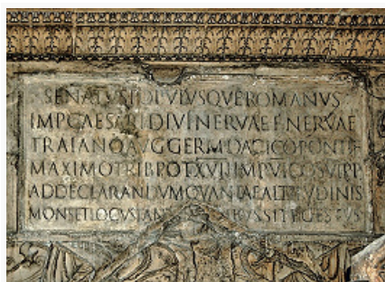
Образец монументального письма. Надпись на цоколе колонны Траяна в Риме. Ок. 114 н. э.

ЛАТИ́НСКОЕ ПИСЬМО́, буквенное письмо, которым пользовались древние римляне и которое стало графич. основой для письменности большинства народов Европы (латиница). Назв. происходит от обл. Лаций . Лат. алфавит сложился под влиянием античного греческого письма . Древнейшие известные лат. надписи [на фибуле из г. Пренесте (ныне Палестрина), на урне из Цере и на стеле рим. Форума] датируются 7–6 вв. до н. э. Направление письма слева направо прочно установилось с 4 в. до н. э. Архаический лат. алфавит состоял из 21 буквы: ABCDEFHIKLMNOPQRSTVXZ. Первоначально буква C, произошедшая от греч. гаммы, обозначала звук [g]. Буква K со временем потеряла вертикальную черту, и её форма приблизилась к начертанию C. В результате этой трансформации к 3 в. до н. э. буква K практически вышла из употребления, а буква C стала обозначать как звук [g], так и звук [k]. Чтобы избежать смешения этих звуков, к древней C добавили снизу вертикальный штрих – так получилось лат. G. Буква Z в 312 до н. э. была упразднена, но позднее вновь стала употребляться для передачи слов греч. происхождения. Для этой же цели была введена и буква Y. Формирование классич. рим. алфавита завершилось в 1 в. до н. э. В нём буква I служила для обозначения как звука [i], так и [j]. Буква V обозначала как [v], так и [u]. С 4 в. для этой цели стала использоваться преим. U. Особый знак для [j] – J – утвердился лишь в 16 в.; в это же время за V закрепилось обозначение звука [v], а за U – [u].