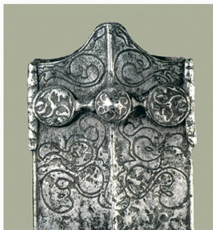
Поселение Латен. Деталь ножен меча. Железо, гравировка. Кон. 3 – нач. 2 вв. до н. э. Кантональный археологический музей (Невшатель).

ЛАТЭН (La Tène), 1) место археологич. находок и древнее поселение на вост. побережье Невшательского оз. и на правом берегу впадающей в него реки (ныне – канала, соединяющего его с Бильским озером), в 7 км от совр. г. Невшатель на западе Швейцарии. Первые вещи и постройки обнаружены Ф. Келлером в 1854; сотни железных и бронзовых предметов подняты из воды Ф. Швабом в 1857–60; раскопки Э. Вуга и П. Вуга в 1907–17. Многочисл. находки [св. 2500, из них более трети – оружие (железные мечи, наконечники копий, детали щитов), остальное – украшения (бронзовые, серебряные фибулы, булавки) и др.] стали основой для выделения культуры и периода Л. Среди др. находок – монеты 1 в. до н. э. – 2 в. н. э., предметы воинского снаряжения рим. времени и др. На поселении изучались свайные постройки неолита, бронзового века, периода Л., рим. времени. Многочисл. находки оружия среднего и позднего (в осн.) Л. объяснялись наличием таможни, воен. лагеря, трактовались как вотивные предметы . Большинство совр.