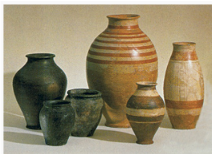
Керамические сосуды. 1 в. до н. э. Исторический музей (Базель).

В ЛТ C 2 (ок. 180/160–120) фибулы утрачивают «расчленённость», вырабатываются варианты В и С по Ю. Костшевскому, показательны типы Мёчвиль и Орнавассо, широко распространены проволочные с двумя восьмёрковидными петлями на спинке; стеклянные браслеты становятся неорнаментированными или с «волнистым» орнаментом; появляется керамика с примесью графита, с вертикальными расчёсами (бытовала до конца периода Л.). К концу среднего Л. исчезает стиль «красивых мечей», прекращается функционирование обширных кладбищ (в Центр. Европе появляются квадратные в плане рвы, заполненные остатками трупосожжений), начинается строительство оппидов .