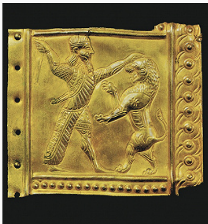
Золотая пластина с рельефным орнаментом. 1-я пол. 7 в. до н. э. Лувр (Париж).

ЗИВИЁ (Секкезский клад), группа находок на холме у дер. Зивие, в 45 км к востоку от г. Секкез, юго-восточнее оз. Урмия (сев.-зап. Иран). Найдена случайно в 1947, поступила в продажу несколькими партиями, состав которых не полностью достоверен. Включает золотые изделия – пектораль, часть диадемы, пластины с изображениями (вероятно, обкладки мечей, колчанов, нашивные пластины, части поясов и др.), серебряный диск с золотыми аппликациями, части бронзовой «ванны», серебряные и бронзовые части узды и поясов, железное оружие, плакетки и фигурки из слоновой кости, керамич. ритоны и др. Прослеживается связь с луристанскими бронзами , иск-вом Ассирии, Урарту, Вост. Средиземноморья, часть изделий относят к местной традиции, развивавшейся в гос-ве Мана (вошло в державу Мидии ). Некоторые изображения выполнены в скифо-сибирском зверином стиле ; вопрос о том, отражают они один из его истоков или зону влияния, остаётся дискуссионным. Традиции, представленные в З., имеют продолжение в иск-ве ахеменидского Ирана. На холме – городище с сырцовыми стенами, есть слои 7 в. до н. э., глазурованные изразцы и др. Осн. часть З. связывают с кладом или погребением 7 в. до н. э. местного правителя или завоевателя, часть вещей – с культурным слоем городища.